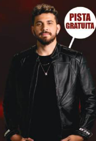
GUSTAVO MIOTO 20 de OUTUBRO