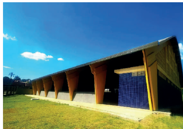
infraestrutura escolar para nossas crianças e jovens, é investir no futuro das conclusões.