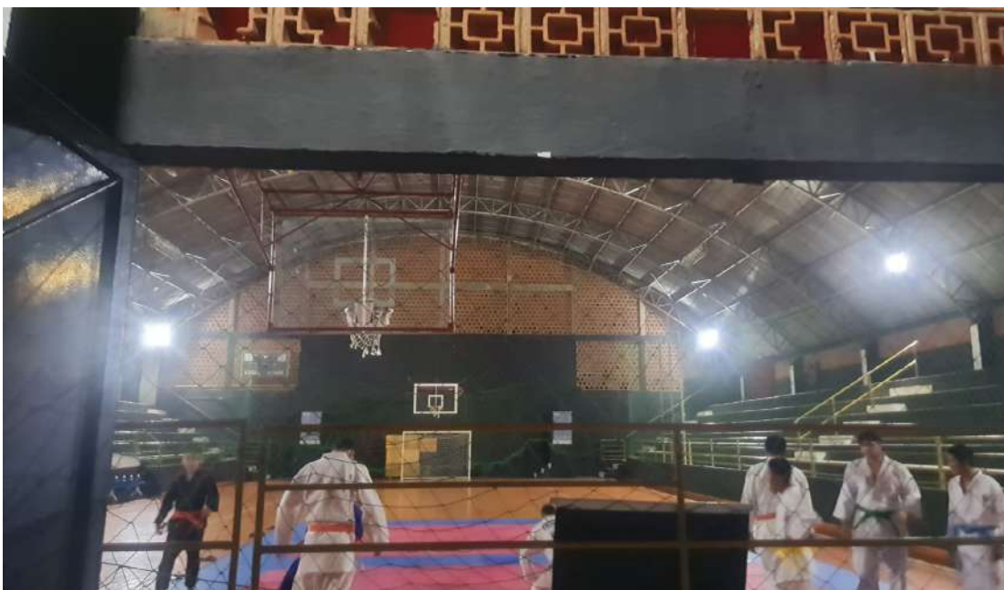
De Mogi Guaçu