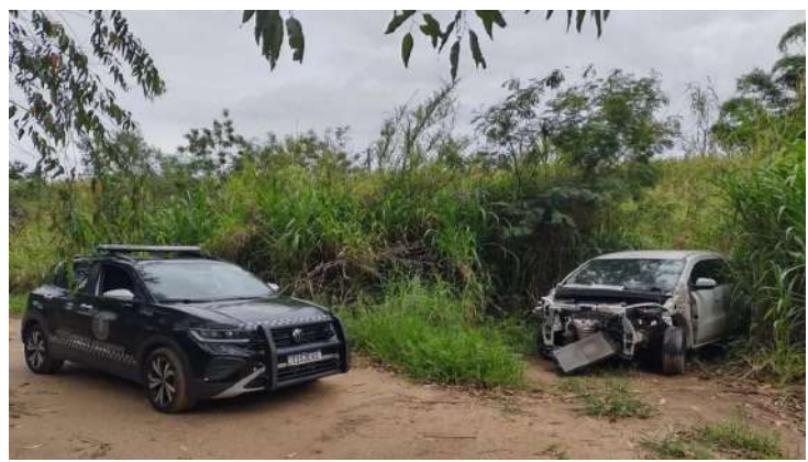
A Guarda Civil Municipal de Santo Antônio de Posse

de Posse localizou, na manhã desta quarta-feira, 17 de dezembro, um veículo produto de furto abandonado e parcialmente desmontado em uma plantação de cana, na região da estrada Oscar Pereira Dias, área rural do município.