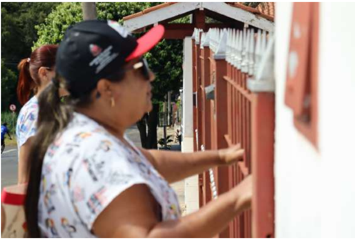
A Prefeitura de Santo Antônio de Posse, por meio da Secretaria Municipal de Saúde,

iniciou o plano intensificado de prevenção e combate à dengue e outras arboviroses para 2026. As ações incluem uso de tecnologia, capacitação das equipes e atualização do Plano Municipal de Contingência.