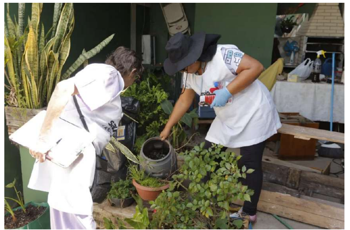
ou atrás dos olhos, a orientação é procurar imediatamente a Unidade Básica de Saúde (UBS) mais próxima.

A Secretaria de Saúde informa que novos mutirões de combate à dengue serão realizados em outros bairros ao longo das próximas semanas. Em caso de sintomas como febre, dor no corpo, dor de cabeça