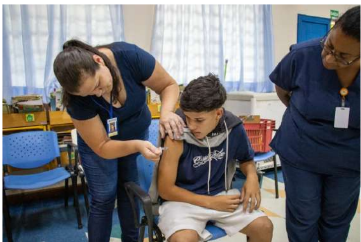
Na tarde desta quarta-feira, dia 21 de

janeiro, equipes das secretarias municipais de Saúde e de Educação se reuniram para discutir o cronograma de ações do Programa Saúde na Escola (PSE), que será desenvolvido ao longo do ano letivo de 2026 na rede municipal de ensino de Jaguariúna.