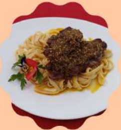
LAMSKOTELLET MET KRUIDEN