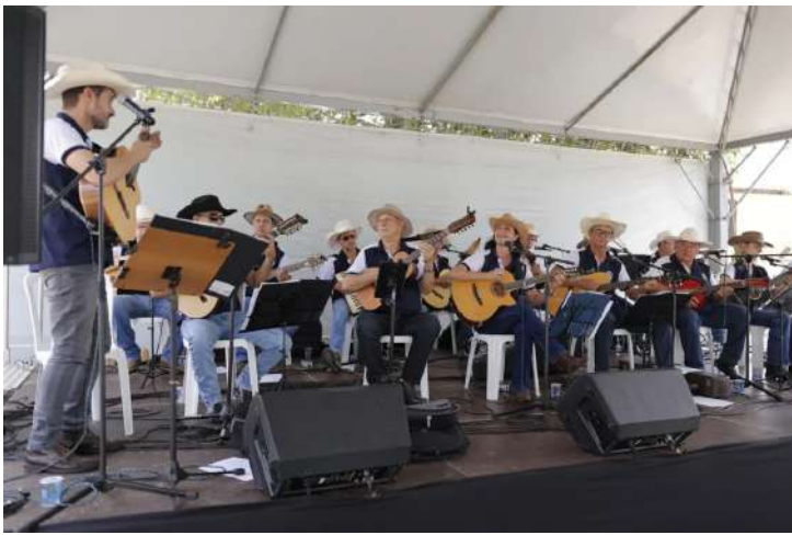
O Centro de Cultura Caipira de Jaguariúna, na Estação de Guedes, volta a receber mais uma edição do Café com Viola. O tradicional evento acontecerá neste domingo, dia 31 de maio, das 9h às 12h, com entrada gratuita.

A programação contará mais uma vez com a apresentação da Orquestra Municipal Violeiros do Jaguary, que traz