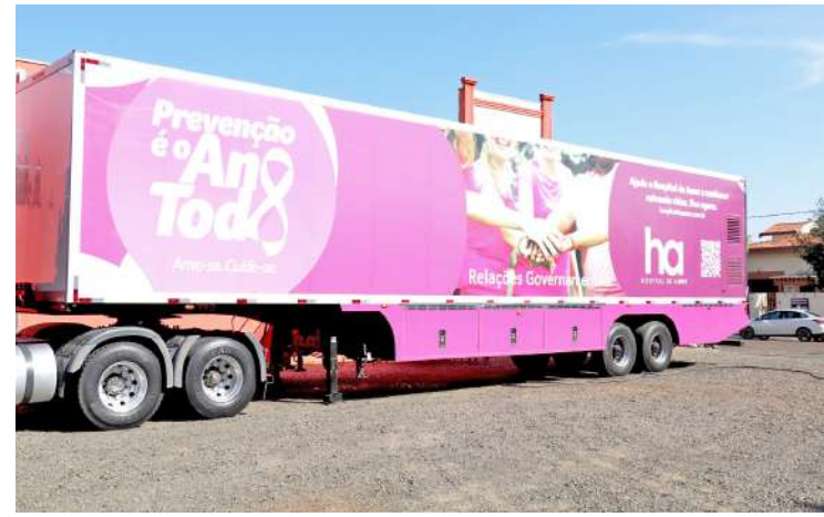
deste tipo nos dois dias.

falou. Papanicolau Além da mamografia, o exame de papanicolau - para prevenção de câncer de colo de útero, também será oferecido na carreta. Neste caso, não é necessário agendamento prévio. Basta ir até o estacionamento do Teatro Municipal nos dias 23 e 24 de agosto entre 8 e 16h com CPF, RG, Cartão SUS e comprovante atualizado de residência. Serão realizados 100 procedimentos