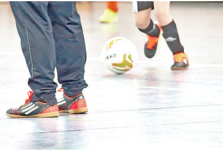
O Campeonato de Futsal Amador de Holambra promete agitar o Ginásio Municipal a

Treze equipes disputam a competição, que reúne jogadores acima de 16 anos