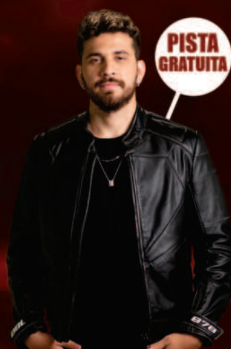
GUSTAVO MIOTO 20 de OUTUBRO