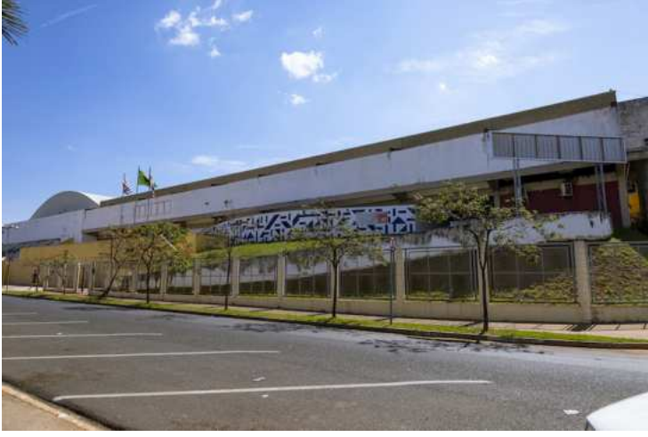
A Prefeitura de Artur Nogueira, por meio da Secretaria de Educação, anuncia a abertura de

inscrições para um novo Processo Seletivo destinado à formação de cadastro reserva para diversos cargos na área educacional.