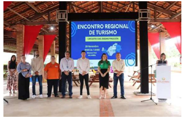
colaborações entre os municípios para potencializar os atrativos turísticos da região.

A realização do Encontro Regional do Circuito das Águas Paulista em Holambra reforça o compromisso das entidades envolvidas com o fortalecimento do turismo como vetor de crescimento econômico e cultural. Além disso, evidencia a necessidade de parcerias e