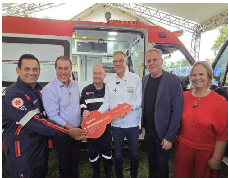
De Mogi Guaçu O Governo Federal entregou no sábado, dia 9 de maio, em Campinas, veículos

do programa Agora Tem Especialistas – Caminhos da Saúde, em uma estratégia para ampliar o acesso da população aos serviços especializados do Sistema Único de Saúde (SUS). Mogi Guaçu está entre os municípios contemplados com uma ambulância do Serviço de Atendimento Médico de Urgência (Samu).