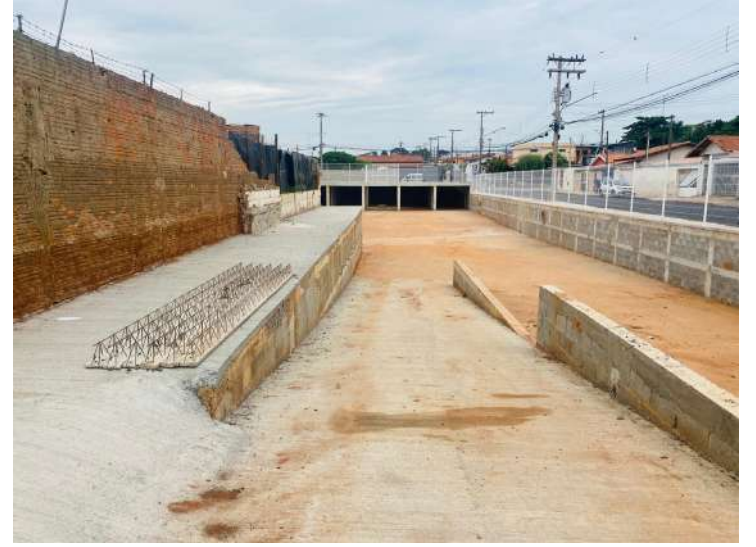
retamente todos os moradores.

A Prefeitura reforça o pedido para que a população colabore na preservação dos espaços públicos, evitando prejuízos que impactam di-