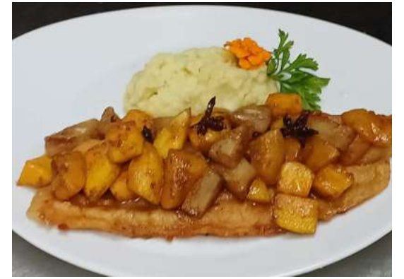
Linguado Picasso com frutas, abacaxi, pêssego e manga. Especiarias, anis, canela, noz-moscada, acompanha purê de batata.