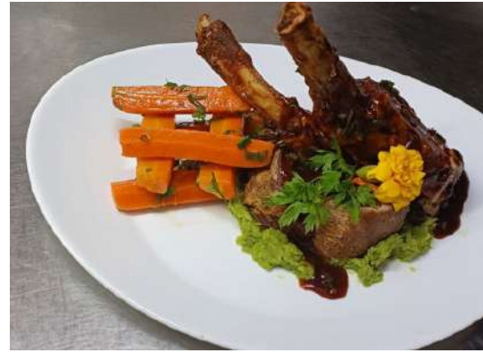
Costelinha Suína Pirulito ao molho oriental, acompanha palitos de cenoura com salsinha e manteiga, purê de ervilhas.