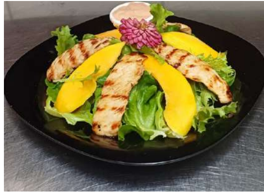
Salada Van Gogh Mix de folhas com lascas de manga e filé de frango acompanha molho rosé