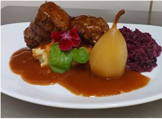
Blinde Vink Bife de Alcatra enrolada com carne moída, temperadas com especiarias e molho Roti, acompanha purê de batata, repolho roxo com condimentos e pera bêbada.