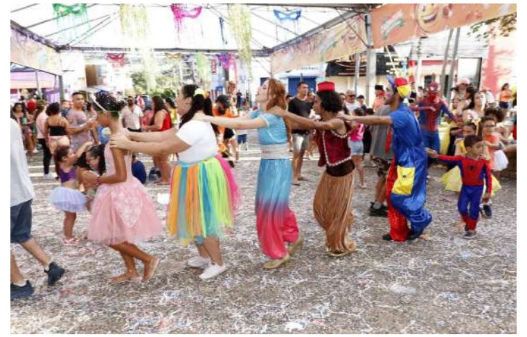
perpetuar essa tradição de alegria e confraternização entre as famílias da região!

Com a mistura perfeita de música, dança, brincadeiras e muita animação, o carnaval de Jaguariúna mostrou mais uma vez que é possível celebrar essa festa tão querida de forma familiar, divertida e inesquecível. Que venham mais edições para