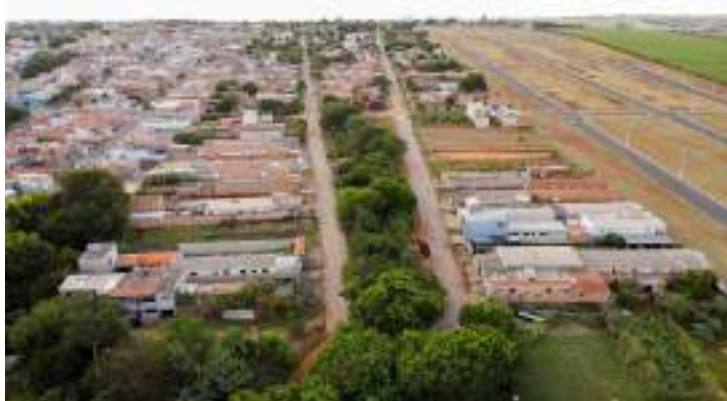
A Prefeitura de Artur Nogueira, por meio da

Secretaria de Obras e Serviços, realizou uma série de melhorias nas estradas do bairro Parque das Palmeiras. As ações visam garantir melhores condições de tráfego para motoristas e pedestres, além de mais segurança e conforto para os moradores da região.