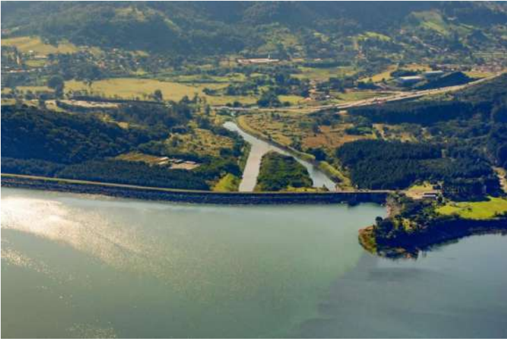
O Serviço de Água e Esgoto de Artur

Nogueira (Saeam) informa que o volume útil do Sistema Cantareira caiu para 41,2% no mês de julho, mantendo a tendência de queda. Os dados fazem parte do Boletim Hidrológico divulgado pelo Consórcio PCJ, que aponta também um cenário de chuvas abaixo da média e vazões reduzidas nos principais rios da região.