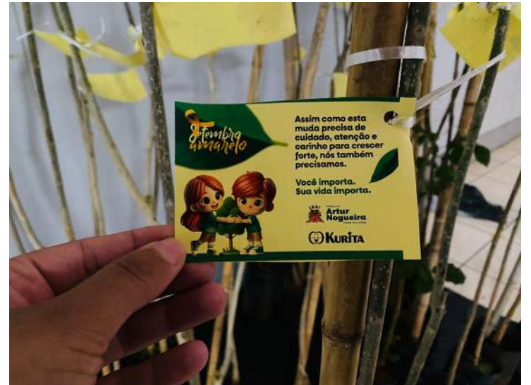
tização ambiental e valorização da vida.

Com a proposta, a Administração Municipal buscou sensibilizar os funcionários e promover engajamento em práticas que unem bem-estar, consciên-