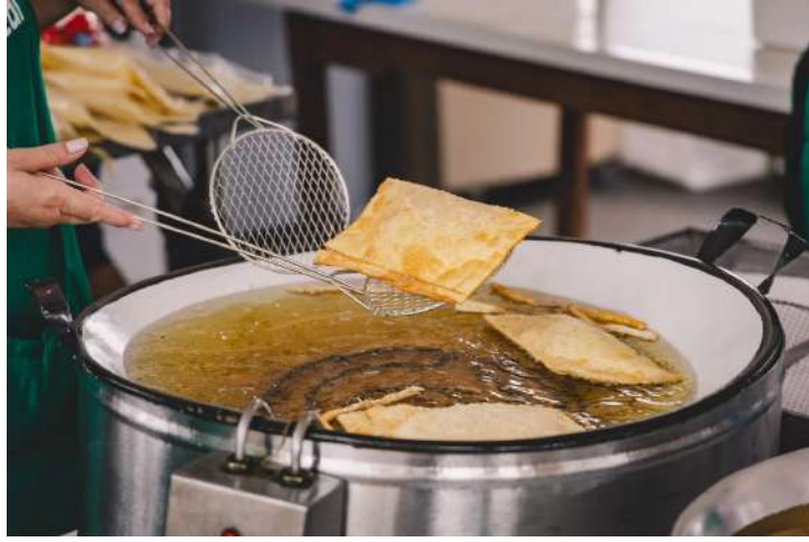
De Artur Nogueira

Integrado ao Natal Encantado, evento terá pastéis variados, atrações musicais e diversão na Praça do Coreto, das 10h às 23h