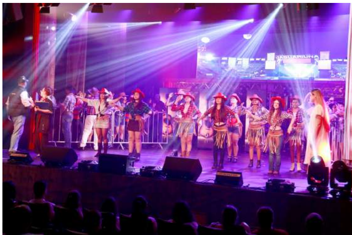
Quem ainda não assistiu ao musical “Jaguariúna – Um Espetáculo de Rodeio” tem a oportunidade de conferir a encenação nesta sexta-feira, 22 de novembro, no Teatro Municipal Dona Zenaide. A peça, que conta com a participação de mais de 600 alunos da Escola das Artes, tem lotado todas as sessões desde domingo (17) e é uma realização da Prefeitura de Jaguariúna, por meio da Secretaria de Turismo e Cultura. As sessões começam às

19h30 e têm entrada gratuita. De acordo com a Secretaria de Turismo e Cultura (Setuc), os ingressos devem ser retirados com uma hora de antecedência, na bilheteria do teatro. A retirada dos ingressos está condicionada à apresentação de um documento oficial com foto, e cada pessoa pode retirar até dois ingressos por CPF. O espetáculo faz parte da Revirada Regional