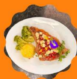
PRIME RIB AO GORGONZOLA