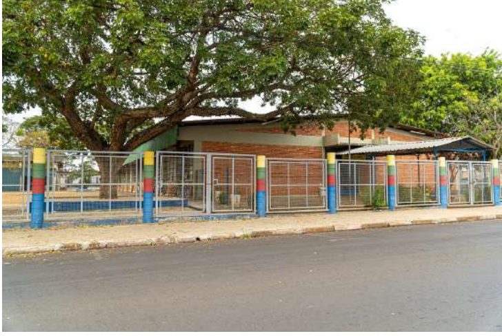
A Prefeitura de Artur Nogueira, por meio

da Secretaria de Educação, está com novas vagas abertas para estágio remunerado de R$ 1.621,00.