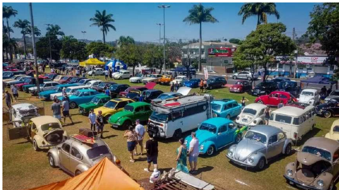
O Encontro Anual de Carros Antigos acontece neste domingo, dia 26

Evento gratuito acontece no Centro Cultural e conta com exposição de veículos, shows musicais, feira de artesanato e praça de alimentação