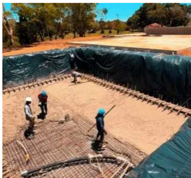
A obra da nova Estação de Tratamen-

to de Água (ETA) no Rio Camanducaia, realizada pela Prefeitura de Jaguariúna por meio do Serviço Autônomo de Água e Esgoto de Jaguariúna (SAAEJA), atingiu aproximadamente 50% de trabalhos concluídos.