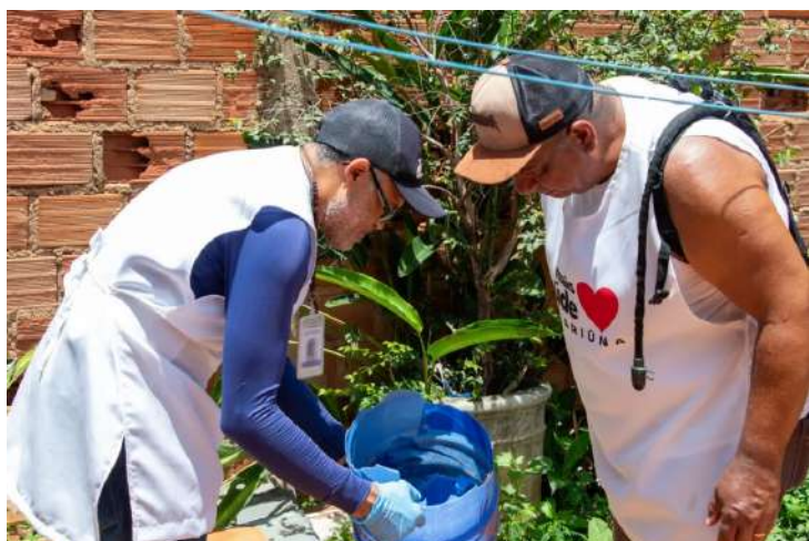
A Prefeitura de Jaguariúna, por meio

O objetivo principal é identificar e eliminar criadouros do mosquito transmissor da dengue, zika, chikungunya e febre amarela