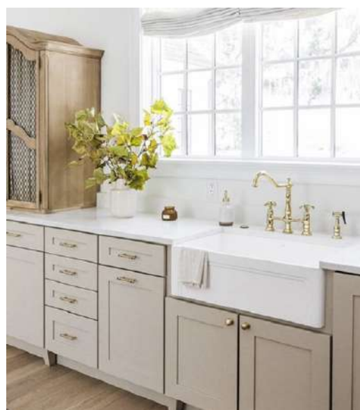
Quando usar a cuba sem encaixe? A cuba semi encaixe é muito utili-

Esse modelo surgiu no século XVII na Irlanda e Inglaterra. Nessa época, ela era usada para lavar panelas grandes, lavar roupa e até dar banho nas crianças. Hoje, a cuba de semi encaixe é comercializada em diversos tamanhos e cores, para você escolher a que mais combina com o estilo da sua decoração. Pensando nisso, hoje vamos te dar as melhores dicas de como escolher a cuba de semi encaixe perfeita para sua decoração. Confira e se inspire com as ideias lindas de banheiro e cozinha!