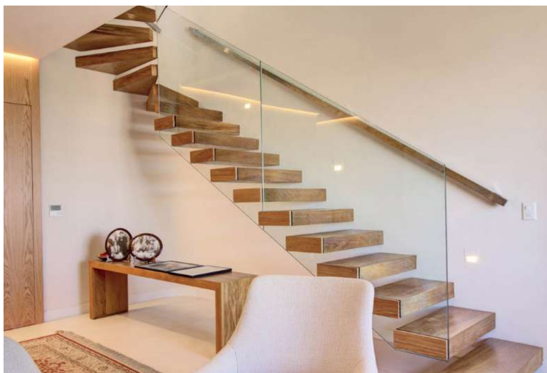
Escada Flutuante de Madeira

No entanto, esse tipo de escada exige um cuidado especial no tipo de vidro para garantir a segurança e a durabilidade da escada. De modo geral, os vidros para escada flutuante mais utilizados e recomendados são o laminado e o temperado.