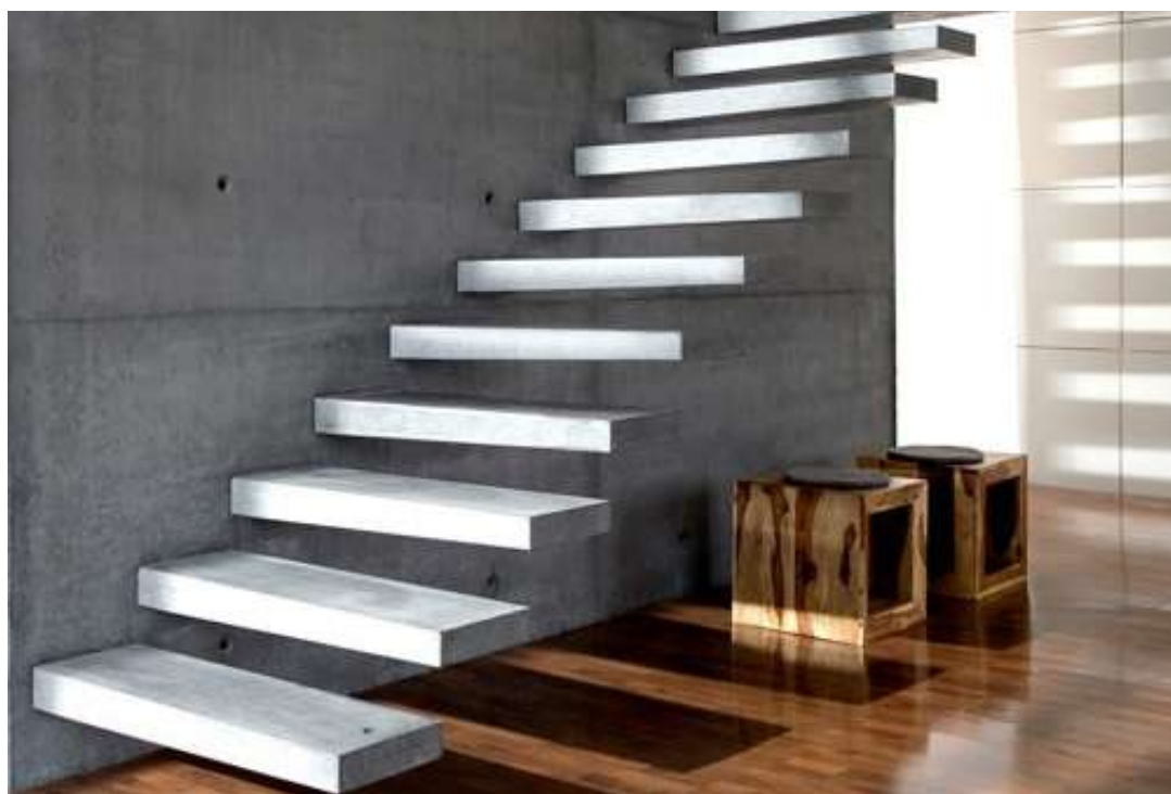
Escada Flutuante de Concreto