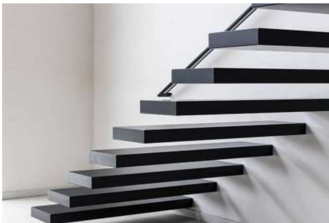
Escada Flutuante Metálica