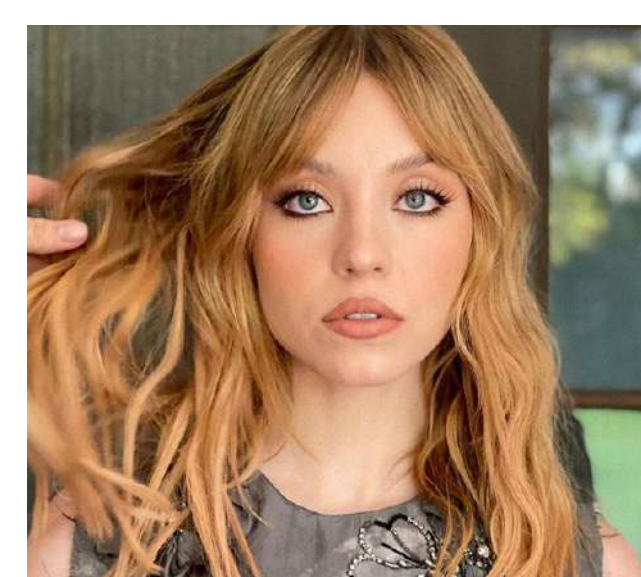
Ruivo doce de leite

Para aqueles que têm tom de pele médio e profundo, investir em um cobre queimado nos fios pode trazer um visual poderoso e elegante. Sendo um dos tons de ruivo mais escuros, o cobre queimado adiciona ao visual um brilho quente e intenso, além de dar um ar mais natural a coloração.