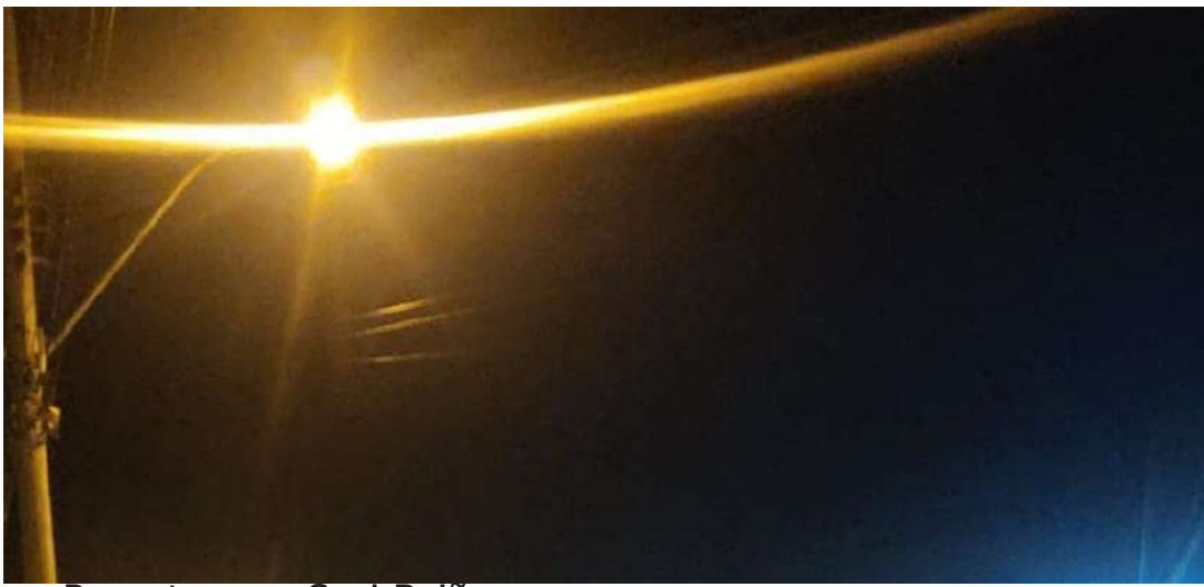
Reportagem: Susi Baião

Funcionárias de um motel no Jardim São Sebastião, na cidade de Jaguariúna passaram por momentos de pânico na madrugada desta sexta-feira (14), quando receberam uma ligação informando sobre um certo assalto em andamento nas dependências do estabelecimento. Apavoradas, elas se trancaram em um dos quartos e acionaram imediatamente a Polícia Militar através do número de emergência 190.