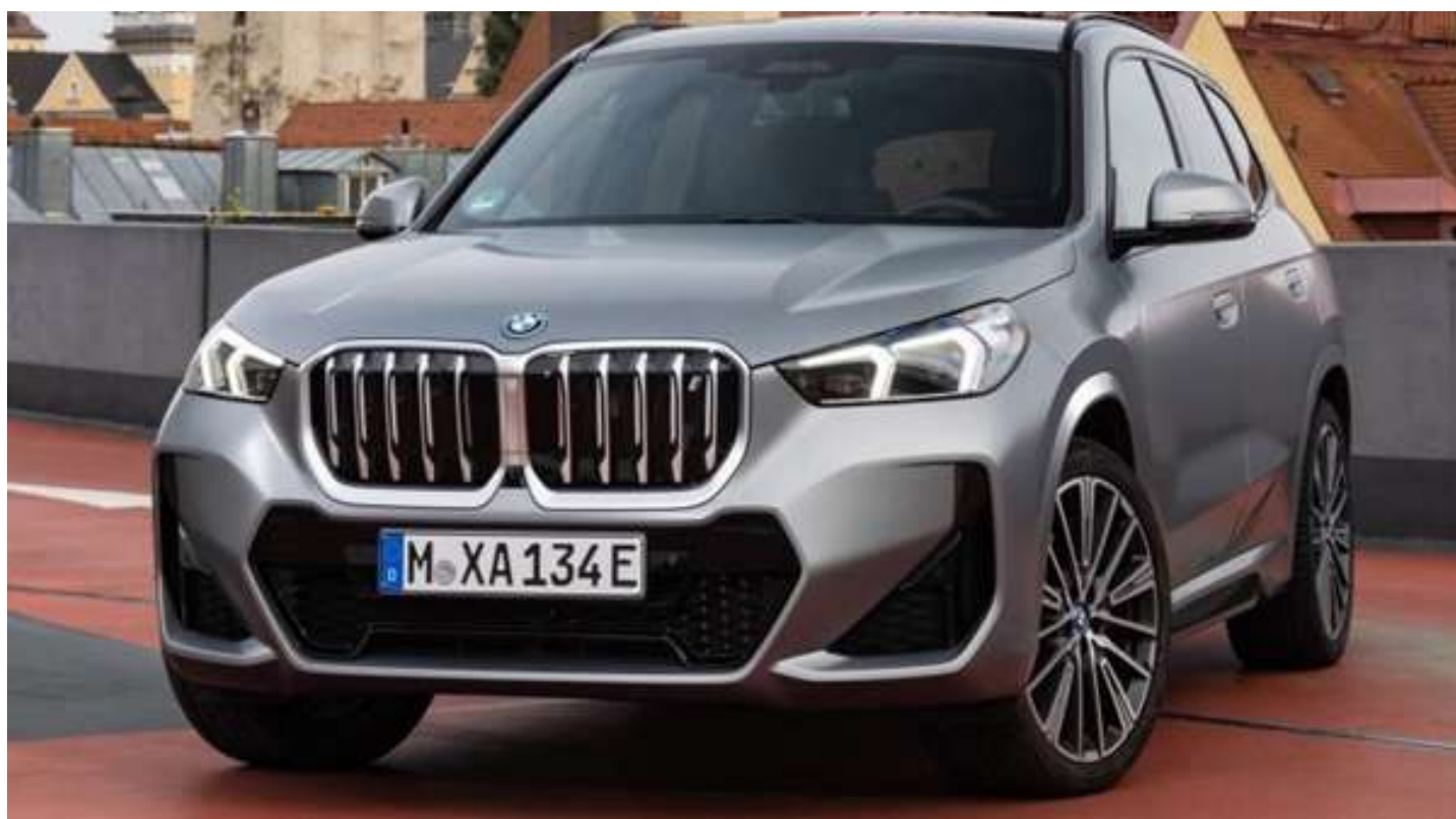
O modelo faz de 0 km/h a 100 km/h em 5,7 segundos

A BMW pretende não ficar para trás no mercado de eletrificados. Após o lançamento do iX3 elétrico, a alemã está quase pronta para lançar sua próxima ofensiva no mercado. O BMW iX1 2023 será lançado depois do novo X1, em outubro de 2022, e com alimentação totalmente elétrica.