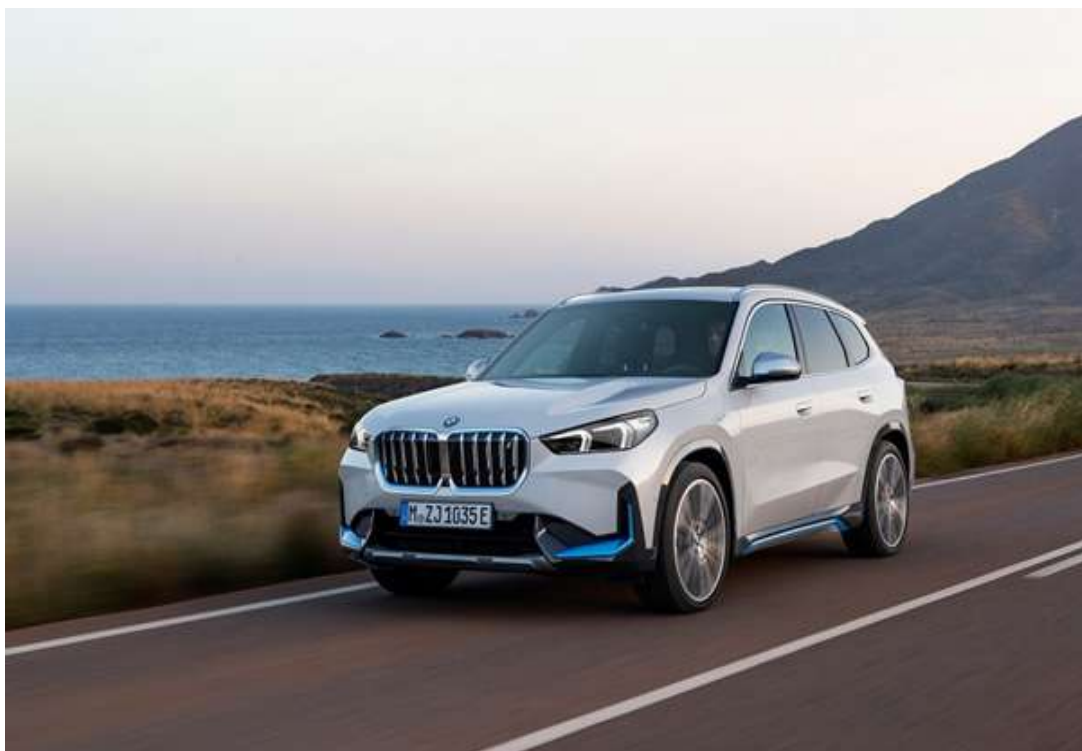
BMW X1 2023

A BMW é eleita a marca favorita dos concessionários brasileiros. A marca conquistou o 1º lugar da 26ª edição da Pesquisa Fenabrave de Relacionamento com as Marcas, realizada pela Federação Nacional da Distribuição de Veículos Automotores (Fenabrave), nos segmentos de Automóveis e Comerciais Leves.