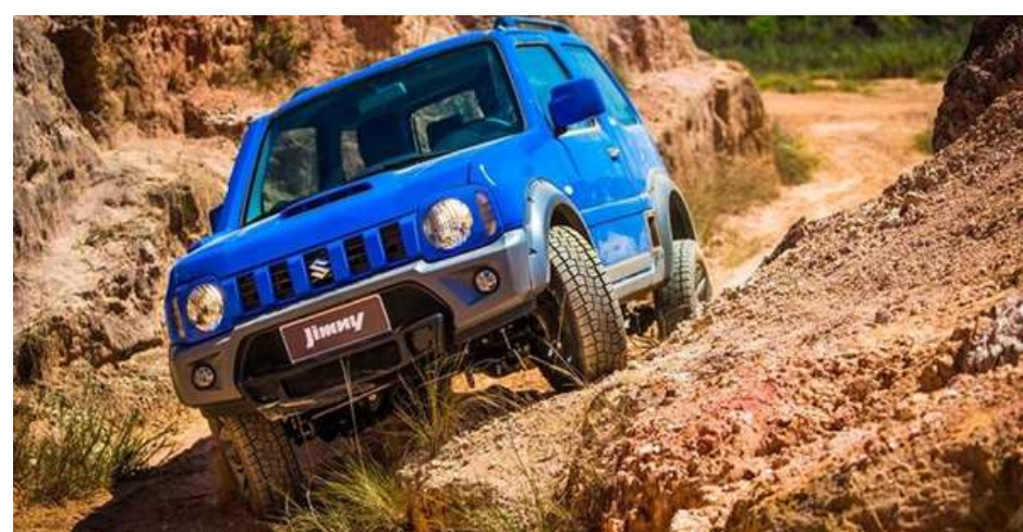
A imagem fala por si só!

Mais um japonês entre os carros inquebráveis, não tem jeito. Tudo bem que aqui falamos de um carro de nicho, um jipe que nasceu para ser robusto e encarar trilhas. Tamanha valentia, contudo, é reforçada pelo conjunto simples, composto pelo motor 1.3 aspirado e câmbio manual com tração reduzida.