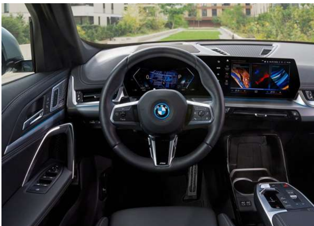
Interior do BMW iX1 2023

A concentração da fabricação dos componentes do novo BMW será Regensburg, na Alemanha. Quem quiser ter um utilitário, elétrico e premium, pode ficar de olho neste modelo que terá os preços mais acessíveis da categoria.