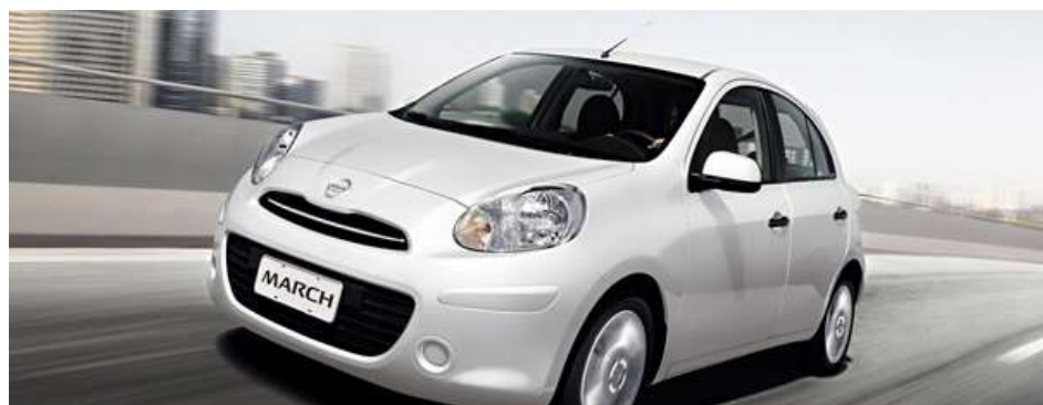
Não importa se foi feito no México ou no Brasil, o March é "feijão sem bicho"

Apesar de ser feito inicialmente no México – e depois no Brasil –, o March sempre foi apontado pela Nissan como um "carro japonês". A fabricante, obviamente, queria colar no compacto a fama de mecânica boa, simples e confiável dos carros oriundos do país asiático. Porém, nem tudo era marketing no caso do hatch.