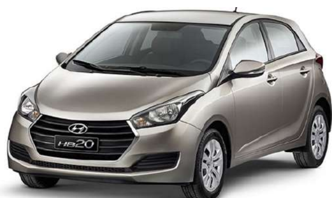
Quando a Hyundai projetou o HB20, ela "dissecou" o Gol para garantir que o carro fosse robusto

Esse entrou recentemente na lista dos carros que não quebram, já que a marca sul-coreana segue muito dos preceitos da filosofia japonesa quando o assunto é automóvel: oferecer carros com mecânica confiável e revisões com preços justos. Com o HB20 a Hyundai seguiu a cartilha direitinho.