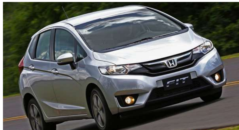
Monovolume japonês é popular pelo bom espaço interno e pela confiabilidade da mecânica

O monovolume da marca japonesa deixou de ser fabricado no país no ano passado depois de quase duas décadas agradando aos seus proprietários pela fama de "duro na queda". Além de espaçoso, o Fit, assim como boa parte dos carros da Honda, também carrega uma aura de carro inquebrável e que não dá problema.