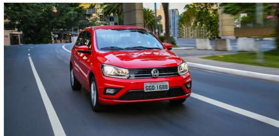
Não importa a geração ou motor sob o capô, o Gol é sinônimo de valentia e inspirou outros populares

O veterano compacto está prestes a se aposentar em definitivo, mas, além das vendas estrondosas e do enorme sucesso comercial, o Gol também sempre foi um carro daqueles inquebráveis. Desde a época de motor do Fusca, passando pela inesquecível era dos motores AP, até mesmo na fase Autolatina com propulsores da Ford e chegando ao fim com motores EA 111 EA 211, o hatch jamais perdeu a alma robusta.