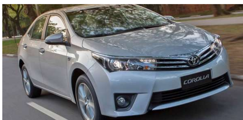
A fama de valente do Corolla não é de hoje e é referência entre os carros que não quebram

O Toyota Corolla é um carro não só queridinho pelos donos, como também muito respeitado entre os mecânicos. Isso porque o sedã médio sempre teve fama de carro que dá pouco problema e de mecânica simples.