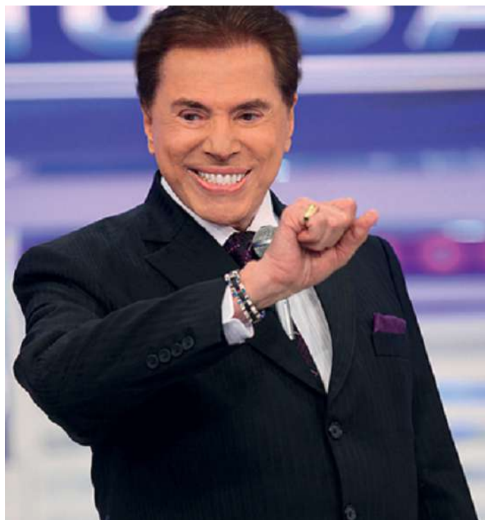
(Imagem : Silvio Santos)

Silvio Santos, mais de ano, ensaiou zilhões de vezes voltar a gravar o seu programa e sempre acabou desistindo na última hora.