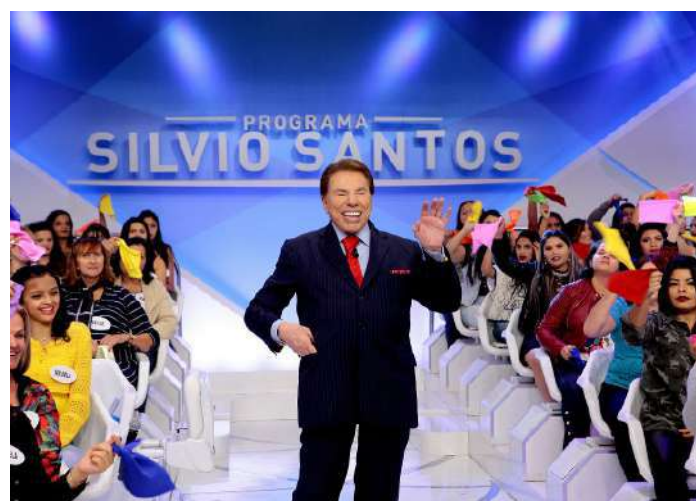
(imagem Silvio Santos)

No fim dos anos 1980, no seu programa do domingo, quadro dos calouros, Silvio Santos disse que ninguém sai de casa para o trabalho querendo errar. Todos vão querendo acertar. Mas em algumas vezes acabam errando.