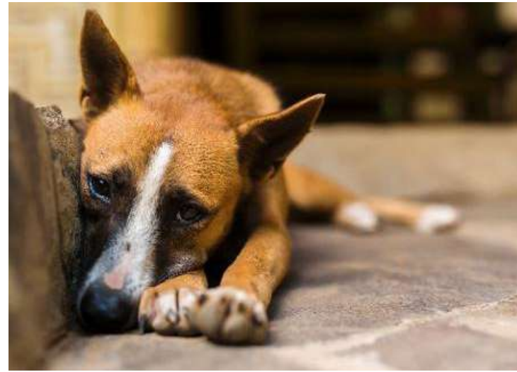
Legenda: Estrutura será instalado na Zoonoses do município para a população de baixa renda