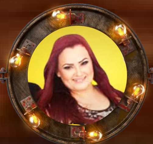
Forrozão Sala de Reboco