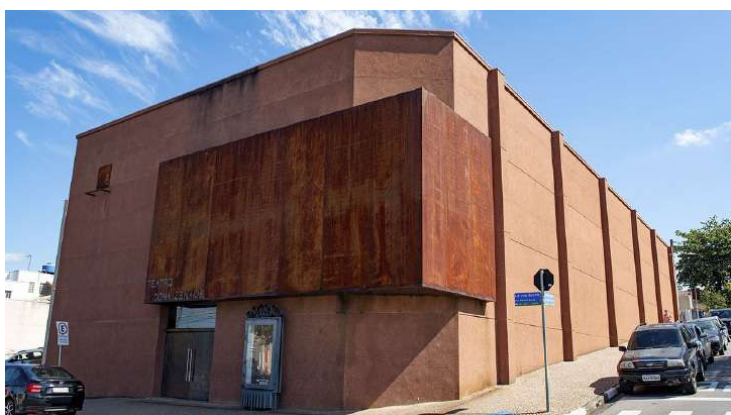
Legenda foto: O Fórum será realizado no Teatro Dona Zenaide

Jaguariúna será sede, no próximo dia 4 de agosto, do Fórum de Líderes do Circuito das Águas Paulista, que terá como objetivo apresentar uma agenda de ações estratégicas para a região e reconhecer os desafios e oportunidades para auxiliar no desenvolvimento econômico, social e ambiental dos nove municípios que compõem o grupo. O evento será realizado no Teatro Dona