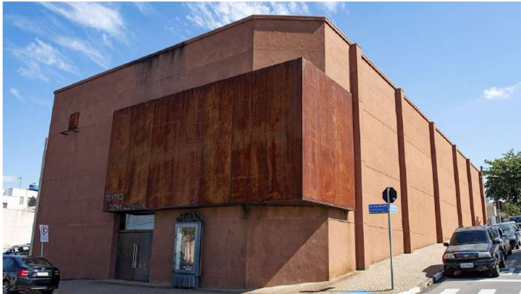
O Fórum será realizado no Teatro Dona Zenaide

Jaguariúna será sede, no próximo dia 4 de agosto, do Fórum de Líderes do Circuito das Águas Paulista, que terá como objetivo apresentar uma agenda de ações estratégicas para a região e reconhecer os desafios e oportunidades para auxiliar no desenvolvimento econômico, social e ambiental dos nove municípios que compõem o grupo. O evento será realizado no Teatro Dona Zenaide, a partir das 18h, e conta com o apoio da Secretaria de Turismo e Cultura de Jaguariúna.