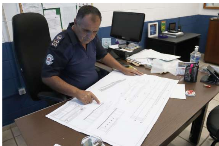
De Mogi Mirim A Guarda Civil Mu-

nicipal de Mogi Mirim finalmente terá o seu próprio Centro de Tre-