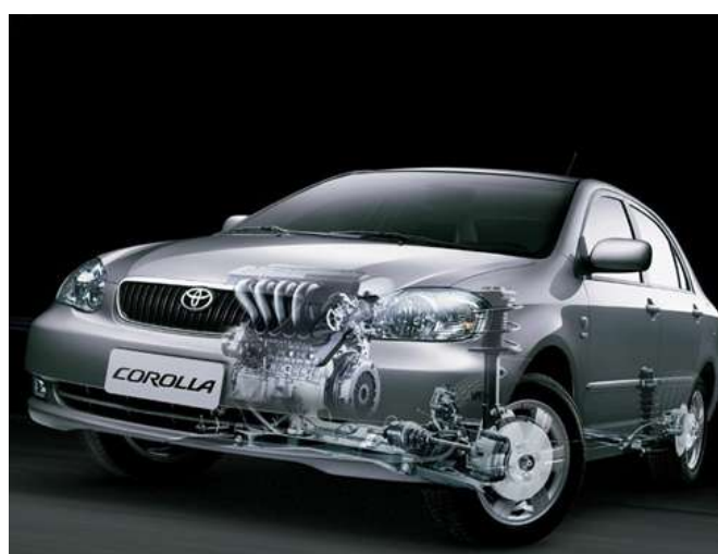
A corrente pode ser considerada como um dos elementos que dão a fama de durável aos Toyota

Os japoneses são adeptos da corrente de comando. Todos os modelos nacionais da Toyota usam esse recurso no lugar da correia dentada. Ou seja, tanto os compactos Etios e Yaris quanto o médio Corolla não exigem preocupar com esse item a curto prazo.