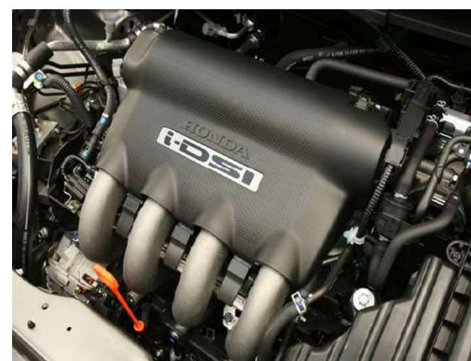
Os japoneses em geral parecem não serem fãs da correia dentada

Está atrás de um Fit, Civic ou CR-V? Pode ficar tranquilo que a troca da correia dentada não estará na lista de manutenções a fazer. A Honda, assim como a Toyota, é adepta da corrente de comando.