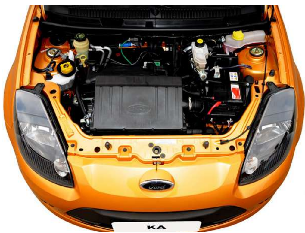
O motor Rocam equipou muitos modelos da Ford no Brasil

O motor Zetec Rocam foi lançado no Brasil em 2000 para substituir o Endura-E, de projeto antigo. O Rocam foi projetado para o Brasil, era derivado do Zetec-SE europeu mas usava bloco de ferro fundido, comando simples no cabeçote e duas válvulas por cilindro.