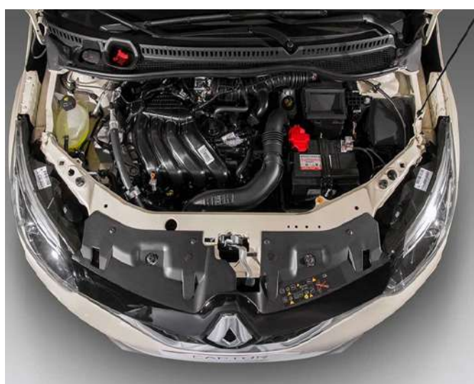
O motor de origem Nissan que equipa a linha Renault traz corrente

A Renault conseguiu construir boa imagem de robustez no Brasil com Sandero, Logan e Duster. A troca dos antigos motores franceses pela nova família ScE em 2016 apenas melhorou isso, junto de um gás no desempenho. Uma das mudanças na troca de motor foi abandonar a correia dentada.