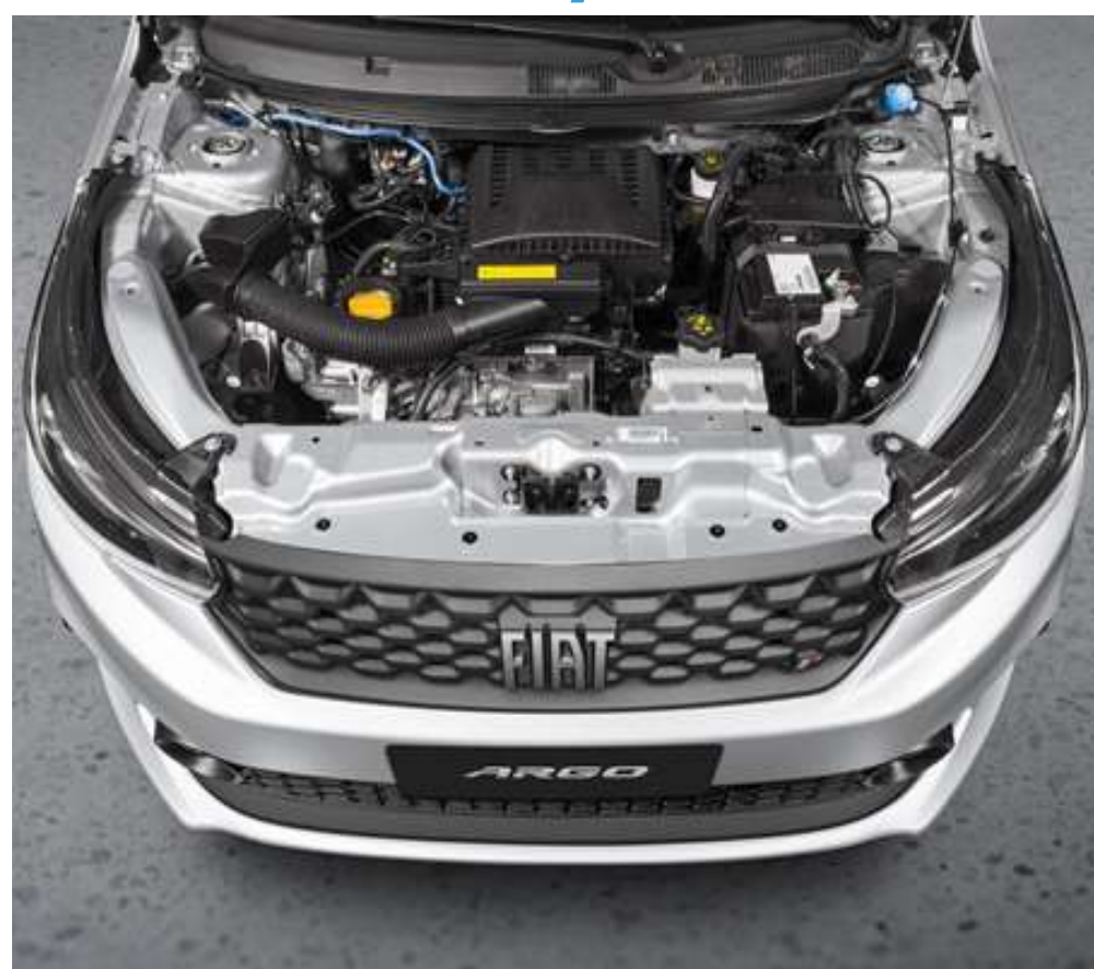
A Fiat projetou o Firefly com soluções para reduzir a manutenção

Assim como o Rocam, o Firefly da Fiat foi projetado tendo o brasileiro em mente. Por isso ele traz duas válvulas por cilindro e corrente de comando mesmo sendo um projeto totalmente novo e feito em alumínio. Isso deixa ele mais barato que o antigo Fire na hora de manter, as revisões tabeladas são mais baratas.