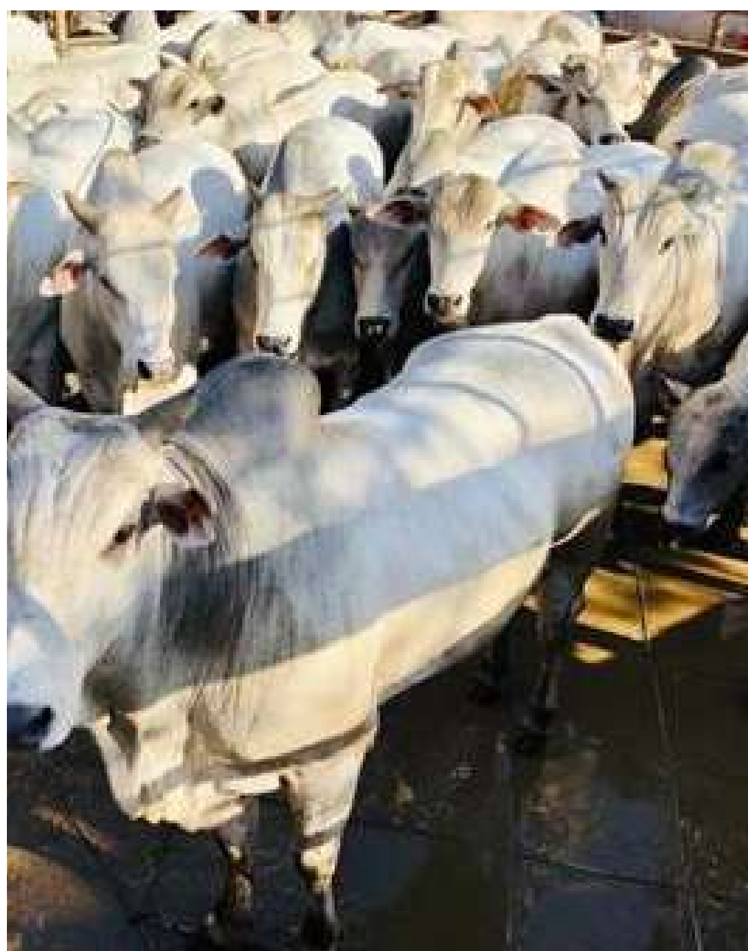
Minerva. O Circuito Nelore de Qualidade é o maior campeonato de

Promovido desde 1999 no Brasil, o Circuito conta com apoio de Friboi, Frisa, Fribal, Masterboi e Matsuda Sementes e Nutrição Animal. Na Bolívia, a iniciativa tem apoio do frigorífico local Fridosa e é organizada em conjunto com a Asocebu. No Paraguai, a organização é da Associação Paraguaia dos Criadores de Nelore, com apoio do frigorífico