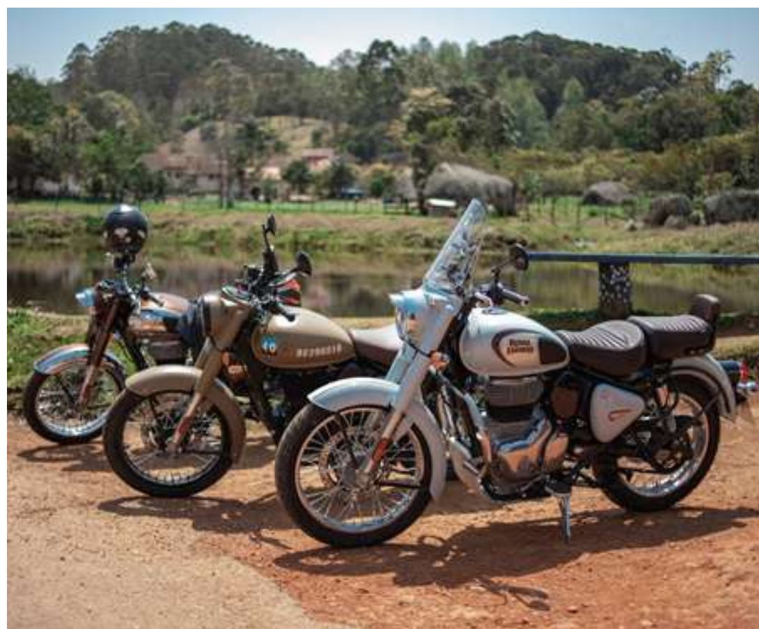
Diferentes versões da Royal Enfield Classic 350

Os interessados podem optar entre os modelos Halcyon, Signals, Dark e Chrome, que variam entre R$ 18.490 e R$ 21.490. A Royal Enfield Classic 350 já está disponível nas concessionárias brasileiras para teste ride e vendas.