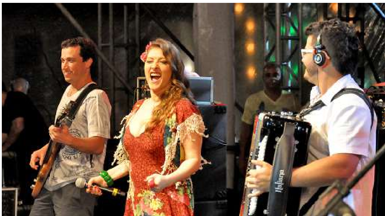
Banda Bicho de Pé se apresenta no domingo (11)