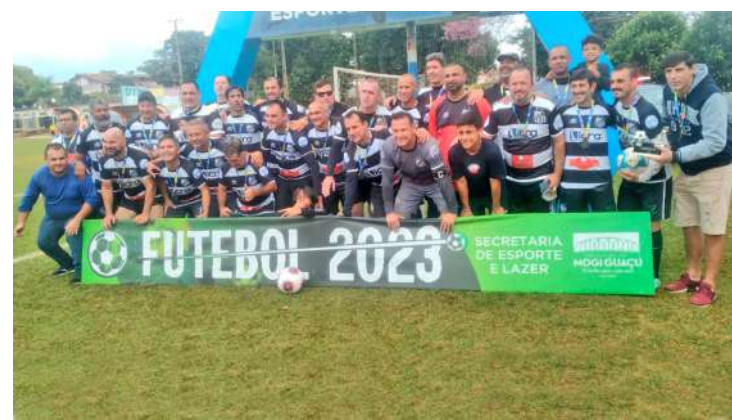
e Vida, enquanto o CE o Família Camarões, de Capelinha é de Conchal e Mogi Mirim.

A competição teve início no dia 23 de abril e reuniu 10 clubes, sendo oito de Mogi Guaçu: Comercial FC/Icra, Ypê Pinheiros, Paulista FC, Jardim Cristina FC, AA Alvorada/Mirante, CFK, Ecobelo Argamassa e Missão Paz