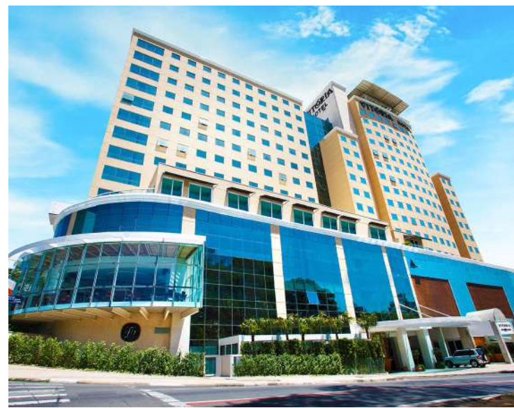
pleta o presidente da Abrasel Regional Campinas

"A Expoflora é uma feira tradicional, que atrai turistas de todo o Brasil e que acaba movimentando o nosso setor de forma significativa, gerando renda e emprego temporário no cerca de 14 mil estabelecimentos da RMC, para dar conta da demanda", com-