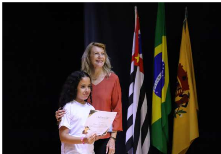
De Mogi Mirim

A Prefeitura de Mogi Mirim, por meio da Secretaria de Cultura e Turismo, promoveu na noite de quinta-feira (5), no teatro do Centro Cultural “Professor Lauro Monteiro de Carvalho e Silva”, a cerimônia de premiação do 13º Concurso Literário “Orlando Bronzatto” o (Pintaca), que neste ano de 2023, recebeu a inscrição de 616 contos de várias regiões do Brasil, nas categorias infantil, juvenil e adulta. O concurso foi realizado pela pasta da Cultura, com o apoio do Conselho Gestor da Biblioteca, a equipe da Biblioteca Pública Municipal, Família Bronzatto e todos os jurados. A