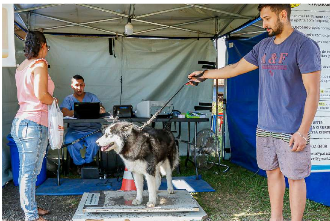
A Prefeitura abriu nesta quarta-feira, 15, as inscrições para a nova etapa