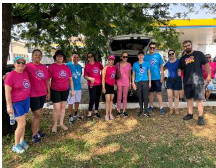
De Mogi Mirim

Apesar do forte calor, quase 300 pessoas participaram na manhã deste sábado (18) da marcha da 2ª Caminhada