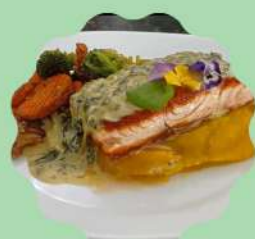
SALMÃO PRIMAVERA COM PURÊ DE MANDIOQUINHA E MOLHO ESPECIAL