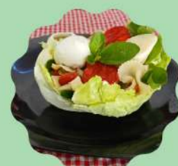
CONCHA DE ALFACE AMERICANA COM FARFALE, PALMITO, TOMATE SECO E MIX DE LEGUMES

Venha conhecer nosso cardápio especial da Primavera!