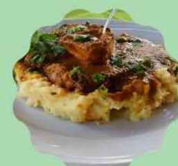
SCHINKEL: OSSOBUCO À SOUS-VIDE E PURÊ DE BATATA