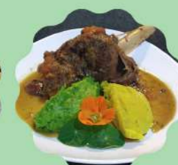
LAMBOUT À MODA TRATTORIA

Horário de funcionamento Segunda a quinta feira das 11:30 às 15:30 Sexta feira a domingo e feriados das 11:30 às 16:00 hrs