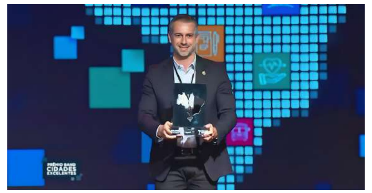
Infraestrutura e Mobilidade Urbana, a cidade ficou, em 2022, com a segunda melhor colocação no Estado no eixo de Sustentabilidade.

“Esse é um prêmio inédito e histórico para nossa cidade. Resultado de um trabalho muito forte que temos procurado fazer com apoio de toda a equipe e, claro, dos moradores, que tanto contribuem diariamente para o desenvolvimento organizado de Holambra”, concluiu o prefeito. Além do segmento de