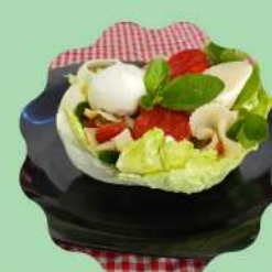
CONCHA DE ALFACE AMERICANA COM FARFALE, PALMITO, TOMATE SECO E MIX DE LEGUMES

Venha conhecer nosso cardápio especial da Primavera!