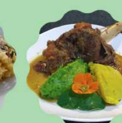
LAMSBOUT À MODA TRATTORIA

Horário de funcionamento Segunda a quinta-feira das 11:30 às 15:30 Sexta-feira a domingo e feriados das 11:30 às 16:00 hrs