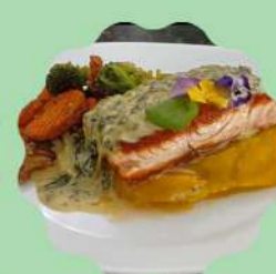
SALMÃO PRIMAVERA COM PURÊ DE MANDIOQUINHA E MOLHO ESPECIAL