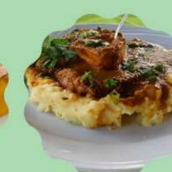
SCHENKEL: OSSOBUCO À SOUS-VIDE E PURÊ DE BATATA