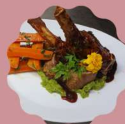
COSTELINHA SUÍNA PIRULITO MOLHO ORIENTAL

Horário de funcionamento Segunda a quinta feira das 11:30 às 15:30 Sexta feira a domingo e feriados das 11:30 às 16:00 hrs