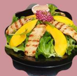
SALADA VAN GOGH MIX DE FOLHAS COM LASCAS DE MANGA E FILE DE FRANGO GRELHADO