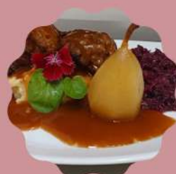
BLINDE VINK BIFE DE ALCATRA ENROLADA COM CARNE MOIDA TEMPERADAS COM ESPECIARIAS E MOLHO RÓTI