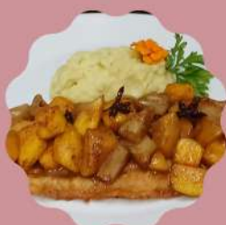
LINGUADO PICASSO COM FRUTAS ABACAXI, PÊSSEGO E MANGA