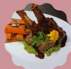
COSTELINHA SUÍNA PIRULITO MOLHO ORIENTAL

Horário de funcionamento Segunda a quinta feira das 11:30 às 15:30 Sexta feira a domingo e feriados das 11:30 às 16:00 hrs