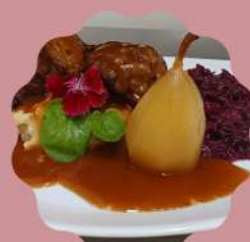
BLINDE VINK BIFE DE ALCATRA ENROLADA COM CARNE MOÍDA TEMPERADAS COM ESPECIARIAS E MOLHO RÓTI