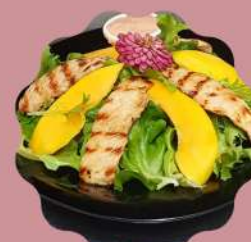
SALADA VAN GOGH MIX DE FOLHAS COM LASCAS DE MANGA E FILE DE FRANGO GRELHADO