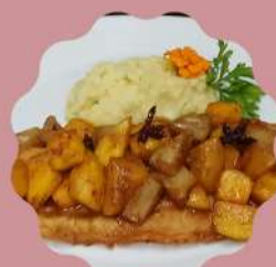
LINGUADO PICASSO COM FRUTAS ABACAXI, PÊSSEGO E MANGA