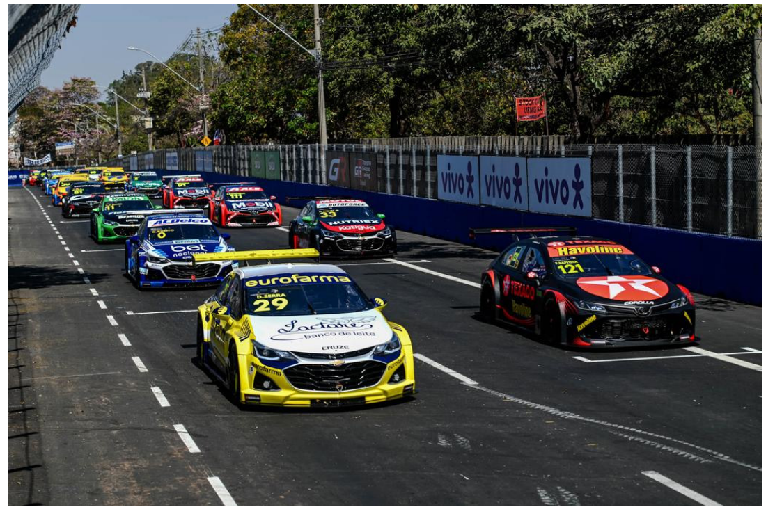
Felipe Baptista coroou domingo com vitória diante da multidão no Mineirão

07 e 08/09 – 8ª etapa, Velopark (RS) 05 e 06/10 – 9ª etapa, Buenos Aires, Argentina 25 e 26/10 – 10ª etapa, El Pinar, Uruguai 23 e 24/11 – 11ª etapa, Cascavel (PR) ou Brasília (DF) 14 e 15/12 – 12ª etapa, Interlagos (SP)