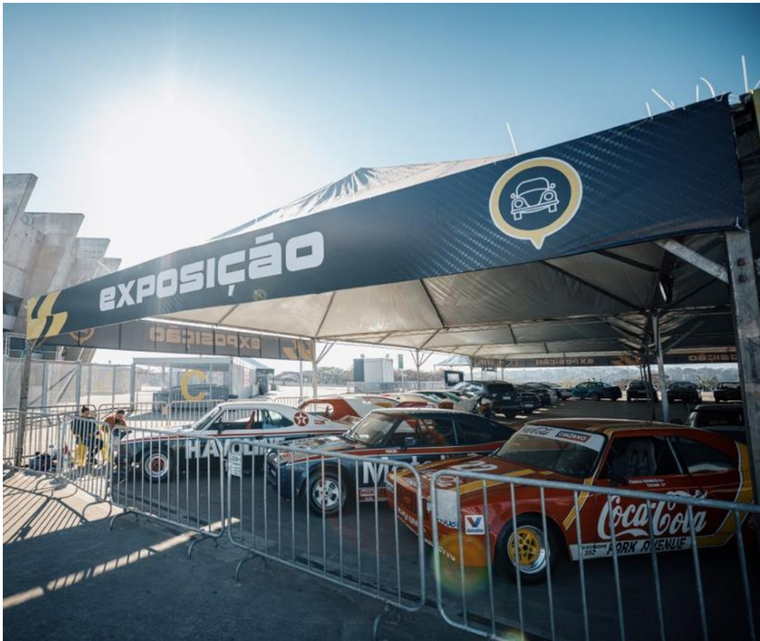
Esplanada do Mineirão tem carros que marcaram época no automobilismo brasileiro

O BH Stock Festival leva à Esplanada do Mineirão muita velocidade, diversão, shows inesquecíveis para todos os gostos e também uma grande exposição de carros que marcaram a história da Stock Car Pro Series e do automobilismo brasileiro como um todo. Neste fim de semana (15 a 18 de agosto), modelos que marcaram época e consagraram pilotos icônicos em nosso país serão exibidos ao público na Região da Pampulha, onde estará instalado o Circuito Toninho da Matta, palco da primeira etapa da Stock Car nas ruas de Belo Horizonte, capital de Minas Gerais.