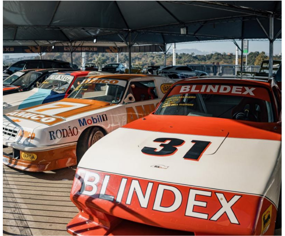
Carros do Acervo José Renato Araújo estão expostos na Esplanada do Mineirão

Modelo: Chevrolet Opala Ano: 1984 Número: 22 Equipe: Metalpó Vitórias: 4 Poles: 1 Pódios: 6 Campeão em 1984