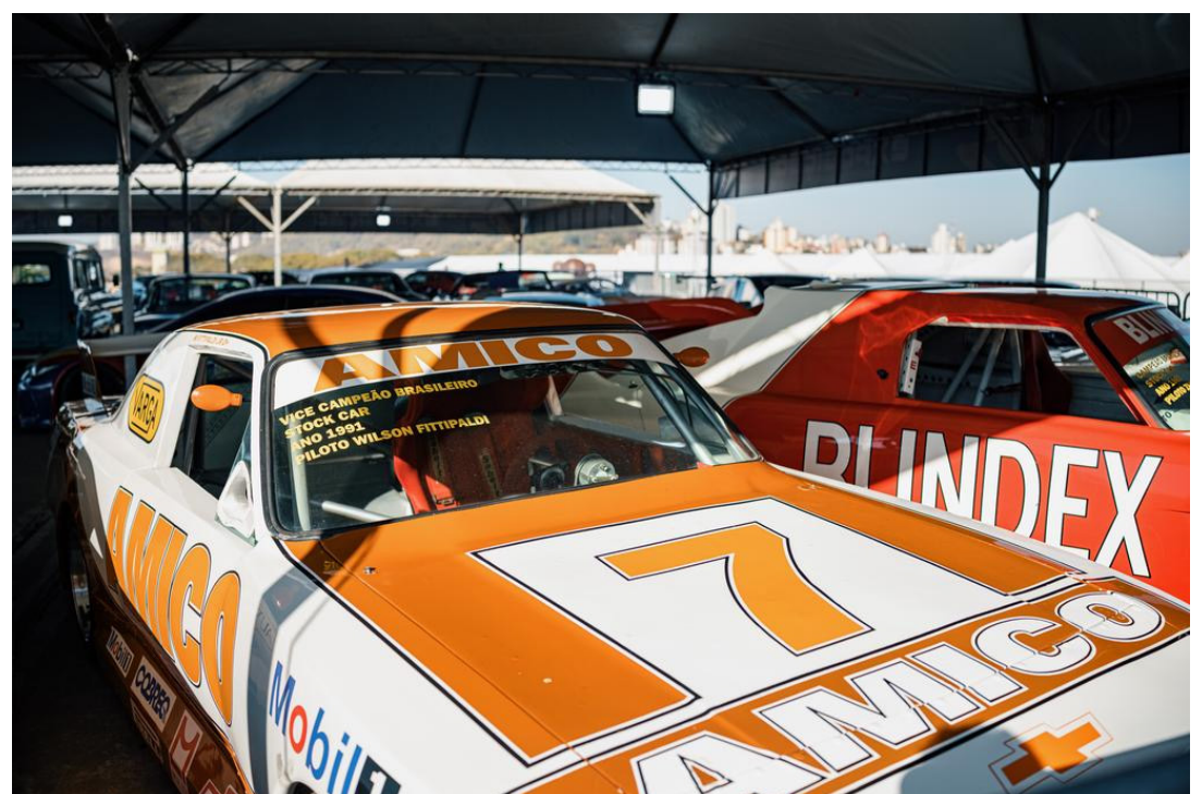
Detalhe do carro com o qual Wilson Fittipaldi Jr. foi vice-campeão em 1991

Carro 9 Piloto: Ricardo Zonta Modelo: Peugeot 307 Sedan Ano: 2009 Número: 42 Equipe: Panasonic Racing 24º em 2008