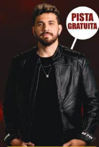
GUSTAVO MIOTO 20 de OUTUBRO