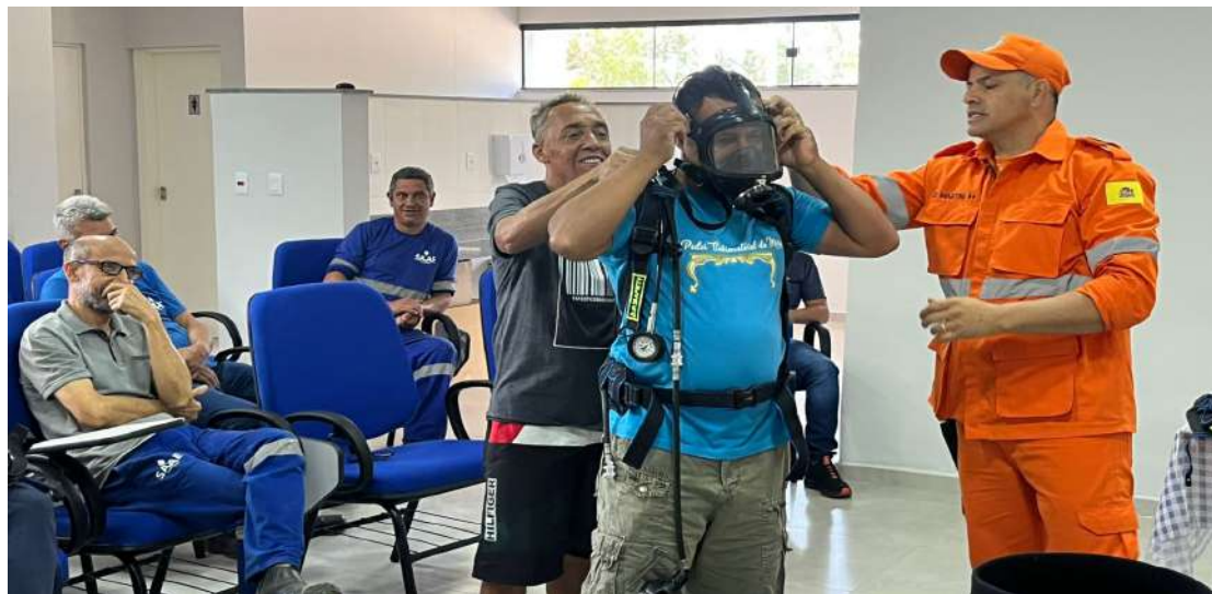
De Mogi Mirim

Servidores da ETA (Estação de Tratamento de Água) de Mogi Mirim participaram, na última semana, de um treinamento de segurança para vazamento de gás cloro. A capacitação aconteceu nos dias 16 e 17, no auditório da estação e teve como objetivo tornar os servidores aptos para fazer as contenções, reparos e fechamento do sistema em