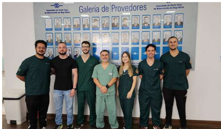
De Mogi Mirim