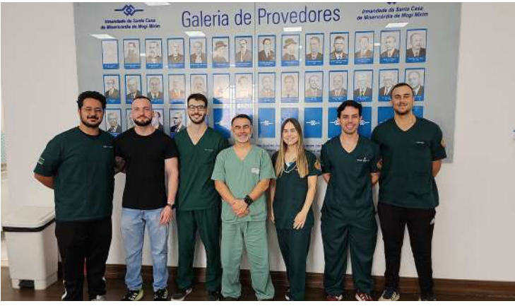
De Mogi Mirim alunos do curso de medicina da Faculdade Franco Montoro. Há cerca de três meses,

estão realizando estágio curricular obrigatório na maternidade e no setor de pediatria da Santa Casa de Mogi Mirim. Esse aprendizado médico foi resultado de um convênio firmado no último mês de maio entre o hospital mogimiriano, a faculdade e a irmandade.