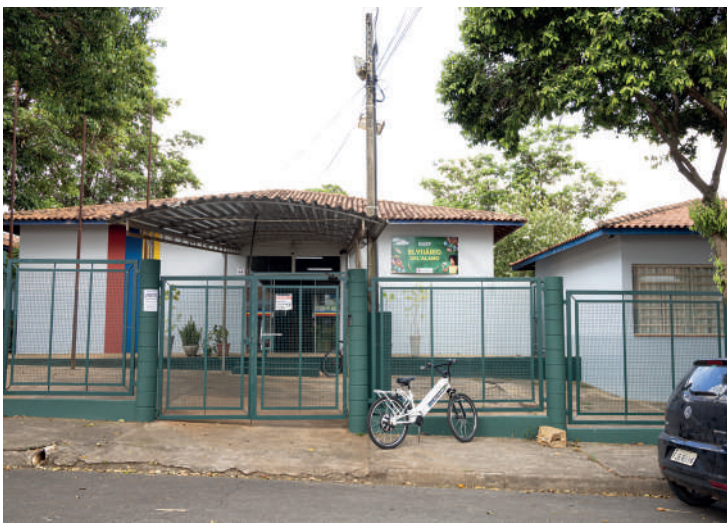
De Artur Nogueira A Educação de Artur Nogueira foi reconheci-

da em nível estadual no Prêmio Excelência Educacional, promovido pelo Governo do Estado