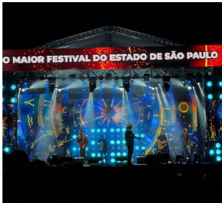
O Festival de Inverno terá um fim de semana de grandes atrações da música brasileira, no Palco

Principal, localizado ao lado da Rodoviária “Salim Oasi”, no Centro. As grandes atrações sempre têm início às 21 horas e contam com transmissão ao vivo pelas rádios Cultura FM 88,5 e Cidade das Águas 101,3.